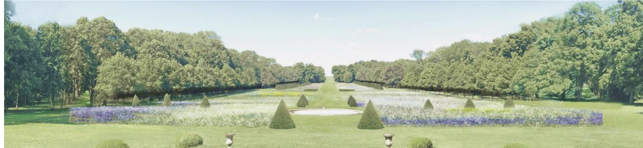
TABLEAU CHANGEANT EN FONCTION DES SAISONS

AVEC UN CHOIX D'ANNUELLES QUI PERMETTENT UNE FLORAISON ÉTALÉE DANS L'ANNÉE